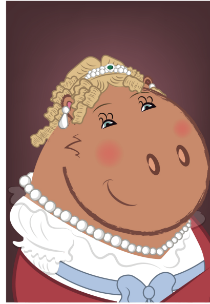
Maria Leopoldina da Áustria

Maria Quitéria fez de conta que era homem para entrar na guerra contra os portugueses. Ela lutou em várias batalhas e ganhou medalha do rei por isso. Ela foi a primeira mulher a fazer parte do Exército Brasileiro.