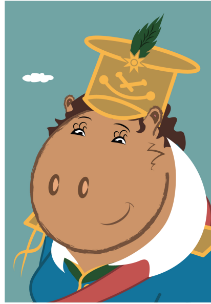
Maria Quitéria de Jesus

Junto com negros e índios, contam que Maria Filipa de Oliveira lutou contra os portugueses que atacavam a Ilha de Itaparica na Bahia e que seu grupo queimou 40 barcos portugueses que estavam ao redor da ilha!