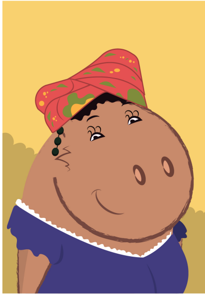
Maria Felipa de Oliveira

Junto com negros e índios, contam que Maria Filipa de Oliveira lutou contra os portugueses que atacavam a Ilha de Itaparica na Bahia e que seu grupo queimou 40 barcos portugueses que estavam ao redor da ilha!